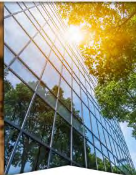
Participación del sector privado en la transición ecológica