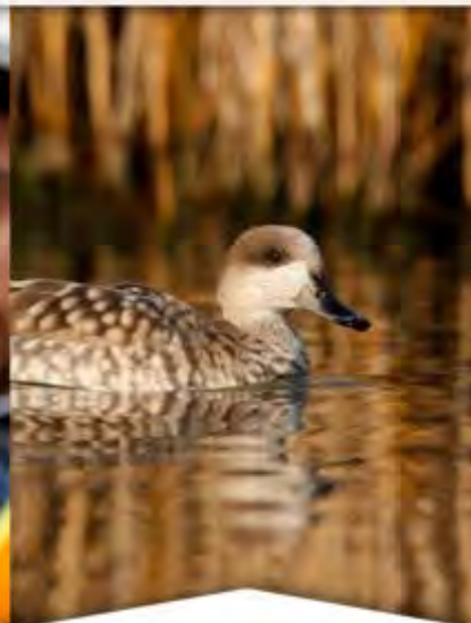
Motores de pérdida de biodiversidad