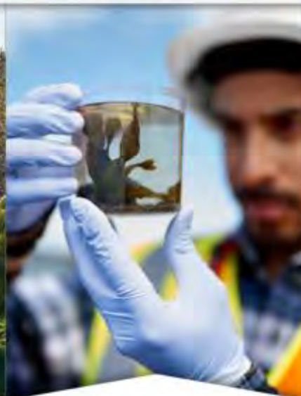
Generación y gestión del conocimiento